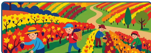
"A Vinha Encarnada em Arles"

Vincent van Gogh foi um pintor muito famoso. Ele utilizava cores fortes e pinceladas dinâmicas para expressar os seus sentimentos.